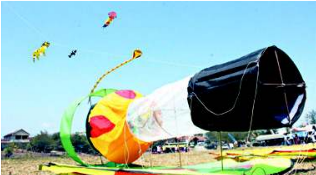
Layang-layang kreasi baru 'Teplok' milik Grup Petruk Magelang ikut Festival Layang-layang Nasional di Pantai Glagah.

ke penghujan (pancaroba), angin biasanya cukup kencang dan sangat mendukung dilaksanakannya Festival Layang-layang Nasional. Sebagai salah satu kebu-