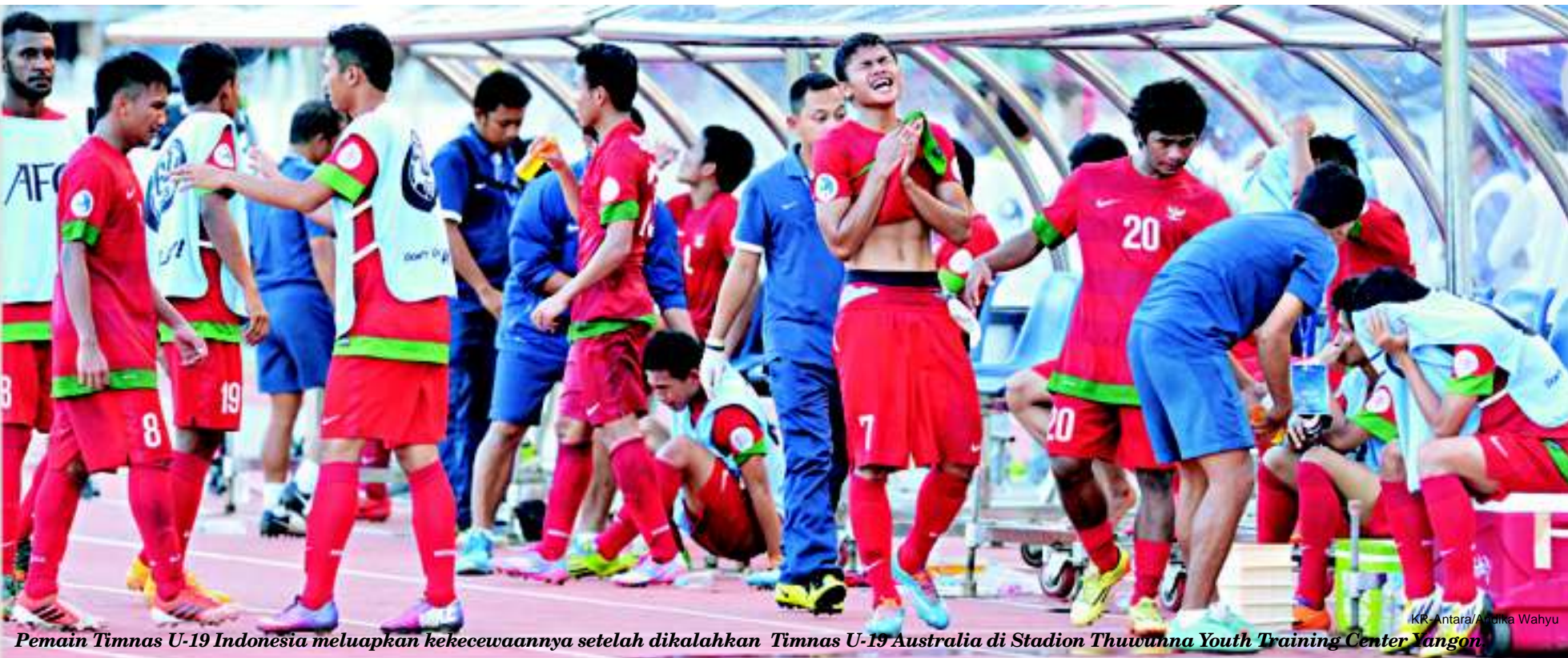
Pemain Timnas U-19 Indonesia meluapkan kekecewaannya setelah dikalahkan Timnas U-19 Australia di Stadion Thunwunna Youth Training Center Yangon.