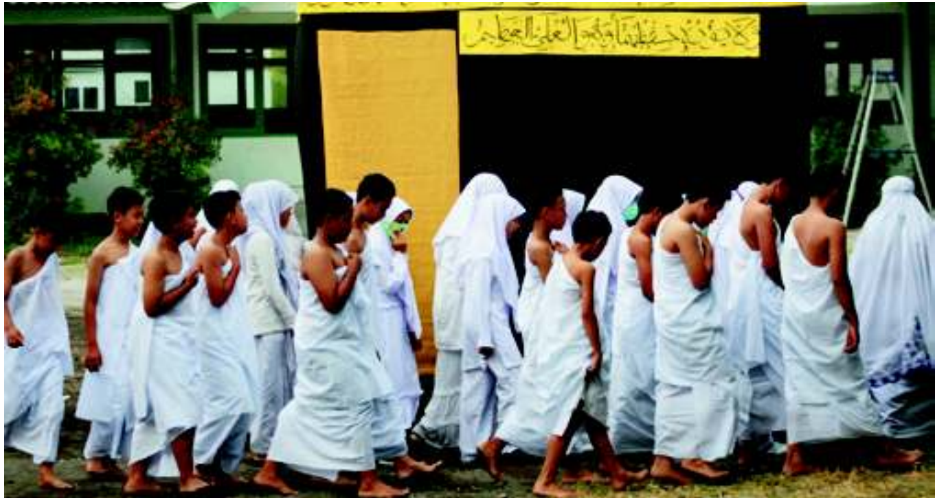
Siswa MTsN Lab UIN Yogya mengikuti prosesi manasik haji di halaman sekolah.