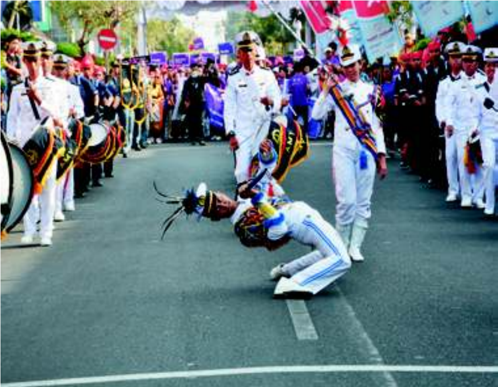
Atraksi memukau drum band Akademi Maritim Yogyakarta (AMY) .