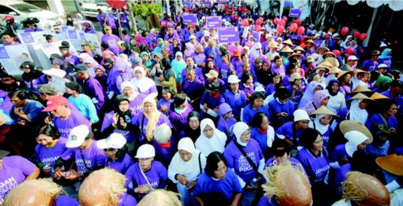
Ribuan warga lanjut usia dari berbagai daerah turut dalam jalan sehat TJF Oktober 2014.