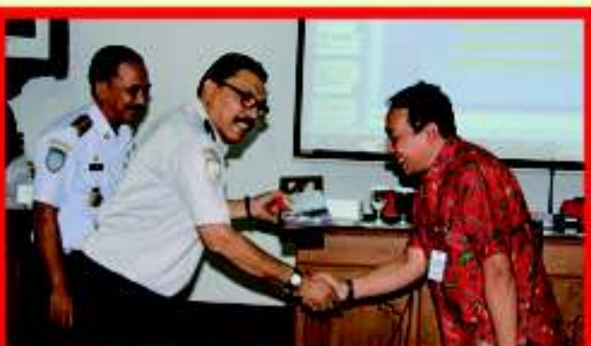
Pemerintah Daerah Bantul menerima Penghargaan Piala Wahana Tata Nugraha (WTN) dari Kementerian Perhubungan RI

Program unggulan KUA Kecamatan Piyungan Kabupaten Bantul yang mengantarkan menjadi yang terbaik di Indonesia diantara lainnya, akselerasi pendaftaran nikah, yakni integrasi program aplikasi pendaftaran nikah antara pihak desa di wilayah Kecamatan Piyungan dengan KUA. Sehingga ketika pihak desa memasukkan data pendaftaran nikah. Sudah secara otomatis data masuk di program aplikasi Sistem Infor-