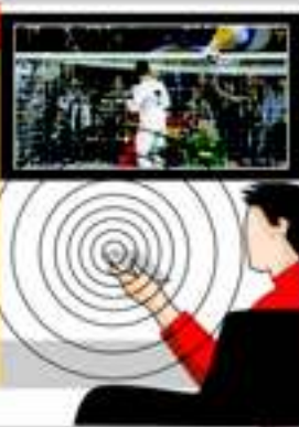
Rustrasi : Anjo

RUGI rasanya kalau memiliki Android tapi tak bisa memaksimalkan fungsinya. Pasalnya, platform OS Android bisa dibantu cukup leluasa untuk diobrak-abrik. Apalagi buat pecinta gadget yang suka bermain gadget sambil nonton TV, bisa menyulap Android menjadi remote TV. Jadi langsung bisa mengontrol-ganti channel siaran TV dari Android, tanpa harus menggunakan